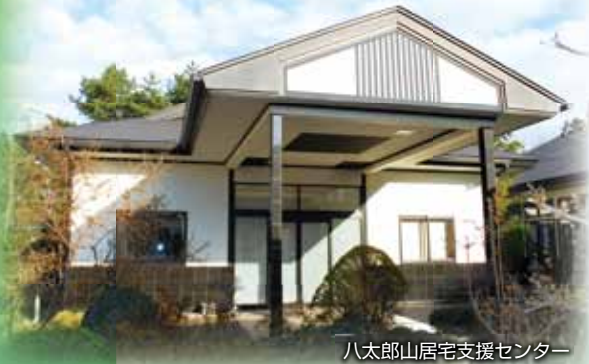
八太郎山居宅支援センター

〒039-1161 青森県八戸市大字河原木字八太郎山3-140 TEL. 0178-21-2238 FAX. 0178-20-6767