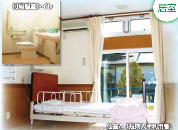
個室A (短期入所利用者)