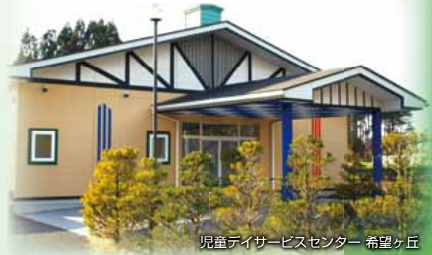
児童デイサービスセンター 希望ヶ丘

〒039-1161 青森県八戸市大字河原木字八太郎山3-138 TEL. 0178-21-1178 (八太郎山療護園) 0178-21-1262 (希望ヶ丘) FAX. 0178-20-1013 (共用)