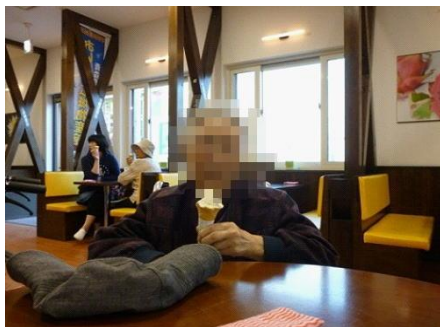
「桜もいいけど、やっぱりアイスだべな! うめ~」