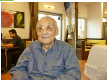
「アイス1個いくらですか？」