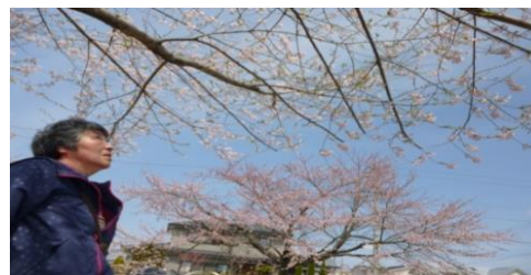
「桜満開できれいだな~」